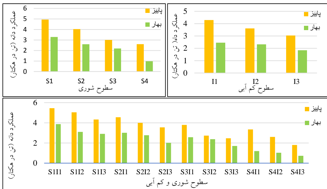
شکل ۲- تغییرات عملکرد دانه در سطوح شوری، سطوح کم آبی و سطوح شوری و کم آبی به صورت توأم

تنش خشکی به صورت مستقیم و غیرمستقیم بر فتوسنتز تأثیر گذاشته و در نهایت باعث کاهش عملکرد می شود. همچنین تنش خشکی از طریق کاهش اندازه یا توقف رشد برگ، سطح فتوسنتز کننده گیاه را کاهش داده و از این طریق باعث کاهش رشد و در نهایت عملکرد رویشی گیاه می شود. مسکینی ویشکایی و همکاران بیان داشتند با اعمال تنش کم آبی از شدت کم (۳۰ درصد تخلیه مجاز رطوبتی)، شدت متوسط (۵۰ درصد تخلیه مجاز رطوبتی) و شدت زیاد (۷۰ درصد تخلیه مجاز رطوبتی) مقدار عملکرد دانه کینوا (رقم تیتیکاکا) کاهش پیدا کرده است (۱۹). به طوری که بیشترین میزان آن در آبیاری کامل برابر ۳/۷ تن در هکتار و کمترین میزان آن برابر ۲/۱۱ تن در هکتار گزارش شد. تیلاهیجو و همکاران نیز گزارش کردند با افزایش تنش آبی در تیمارهای آبیاری کامل، آبیاری با ۶۰ درصد ظرفیت زراعی مزرعه و آبیاری ۳۰ درصد ظرفیت زراعی مزرعه بر روی پنج رقم کینوا (KVL-SRA-2, KVL-SRA-3, Regalona, Q-37 و Q-52)، در هر رقم با افزایش تنش آبی عملکرد محصول کاهش پیدا کرده است (۲۸).