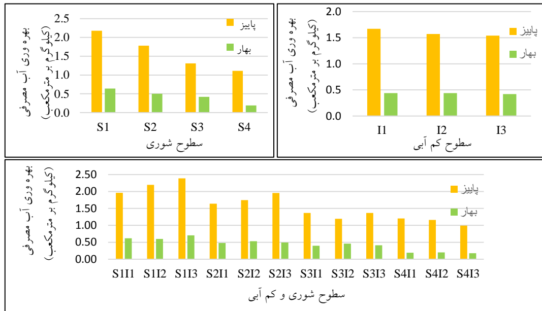
شکل ۷- تغییرات بهره‌وری نسبت به عملکرد دانه آب مصرفی در سطوح شوری، سطوح کم‌آبی و سطوح شوری و کم‌آبی به صورت توأم

توجه به محدودیت منابع آب در استان خوزستان و عدم بارندگی و نیاز آبی زیاد در دوره کشت بهار گياه کینوا، کشت این محصول در فصل بهار توصیه نمی‌شود.