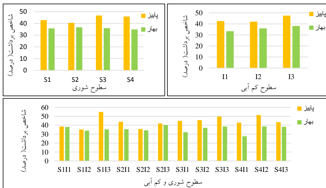
شکل ۴- تغییرات عملکرد بیولوژیکی در سطوح شوری، سطوح کم‌آبی و سطوح شوری و کم‌آبی به صورت توأم

در کشت بهار نیز اثر تنش کم‌آبی مانند اثر تنش شوری معنی‌دار نبود و همه تیمارها از نظر آماری در یک گروه قرار گرفتند. بیشترین مقدار شاخص برداشت در تیمار I3 و پس‌از آن تیمار I2 و I1 به ترتیب با مقادیر ۳۸/۱۲، ۳۵/۹ و ۳۳/۳۷ درصد قرار گرفتند. بر اساس نتایج پژوهش بیرامی و همکاران اثر تیمارهای مختلف رطوبتی در دو فصل کشت بهار و پاییز بر شاخص برداشت کینوا (رقم تیتیکاکا) معنی‌دار نبود (۴).