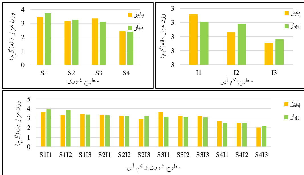
شکل ۶- تغییرات هزاردانه در سطوح شوری، سطوح کم-آبی و سطوح شوری و کم-آبی به‌صورت توأم

اثر متقابل تنش‌های شوری و کم‌آبی در کنار یکدیگر، بر وزن هزاردانه کینوا در فصل پاییز تأثیر معناداری نداشت اما در فصل بهار تفاوت معنی‌داری در سطح احتمال یک درصد ایجاد نمود. تغییر وزن هزاردانه در تیمارهای این آزمایش، از ۳/۶۱ گرم برای تیمار S3I1 تا ۲/۰۳ گرم برای تیمار S4I3 به‌دست آمد. همچنین در فصل بهار به ترتیب در تیمارهای S1I1 و S4I3 با مقادیر ۳/۹۲ و ۲/۱۸ گرم بیشترین و کمترین مقدار وزن هزاردانه مشاهده گردید.