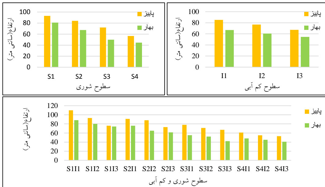
شکل ۵- تغییرات ارتفاع گیاه در سطوح شوری، سطوح کم آبی و سطوح شوری و کم آبی به صورت توأم

کردند (۲۷). نتایج زندی و همکاران نشان داد که تنش شوری موجب کاهش ارتفاع گیاه کینوا (رقم سانتاماریا) شده و با نتایج این تحقیق مطابقت دارد (۳۲).