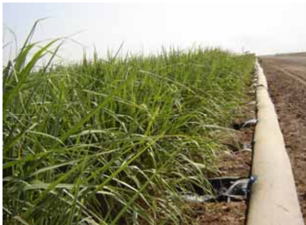
تصویر ۲. لوله هیدروفلوم در حالت آبیاری یک جویچه در میان