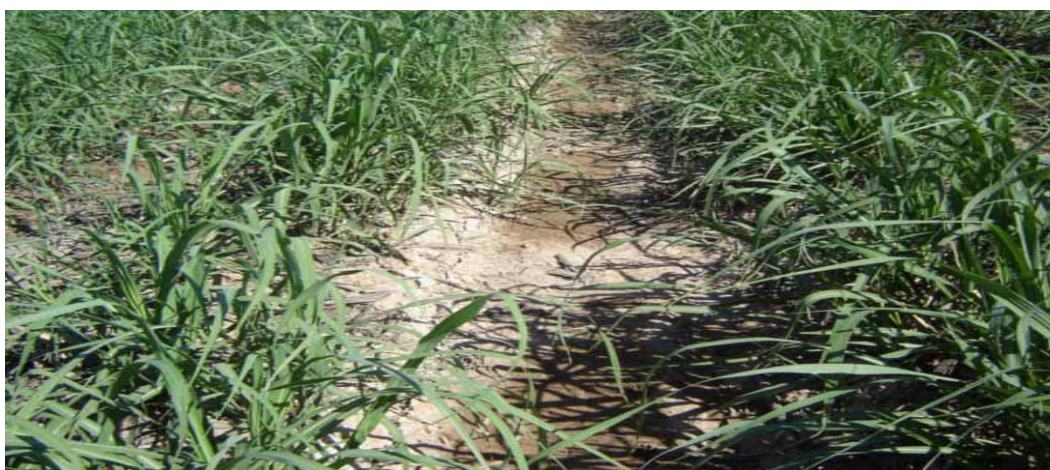
تصویر ۴. نحوه جریان آب از یک جویچه آبیاری شده به یک جویچه آبیاری نشده