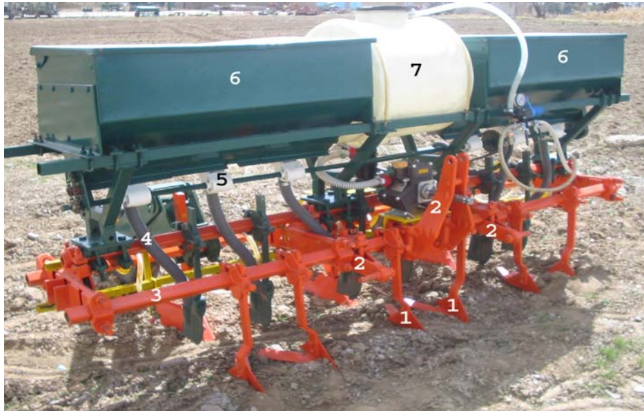
شکل ۱. ماشین کمبینات (دید از جلو) ۱- تیغه سرنیزه‌ای ۲- سه نقطه اتصال به تراکتور ۳- تیرک افزار ۴- لوله سقوط ۵- مقسم کود ۶- مخزن کود ۷- مخزن سم