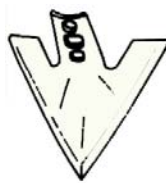
High-Crown Sweep (پنجه‌غازی)