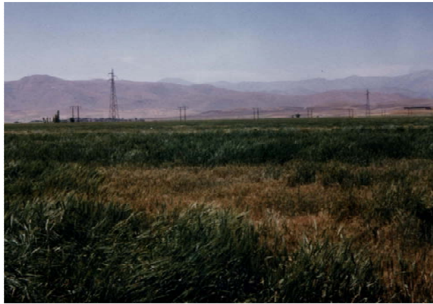
شکل ۱. مزرعه گندم مبتلا به پوسیدگی ریشه و طوقه در اثر شبه جنس Bipolaris