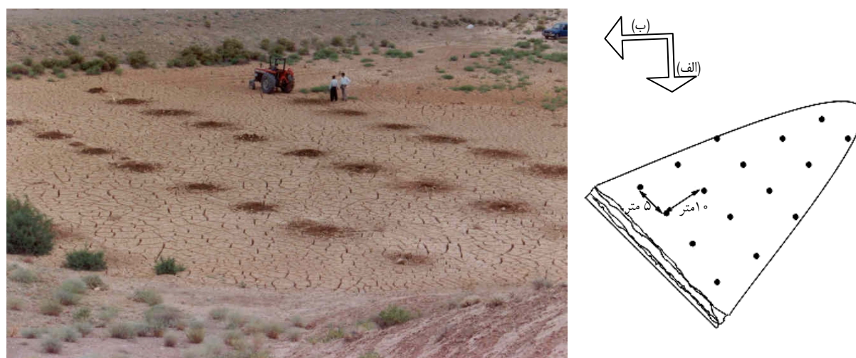
شکل ۲. محل‌های نمونه برداری در مخازن سدها (الف) و نمونه‌ای از مناطق حفر چاهک‌های گمانه‌ای در مخزن سد عمران (ب)