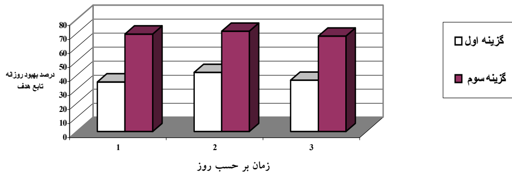
شکل ۳. مقایسه درصد بهبود روزانه تابع هدف در گزینه‌های اول و سوم برای سه روز آخر تقویم انتخابی

حاکمی از آن است که مدل مورد نظر توانسته است جواب‌های معتبری را در زمان نسبتاً کوتاهی ارائه نماید. برای اطلاع از جزئیات روش‌های به کار گرفته شده و نتایج به دست آمده می‌توان به مرجع (۳) مراجعه نمود.