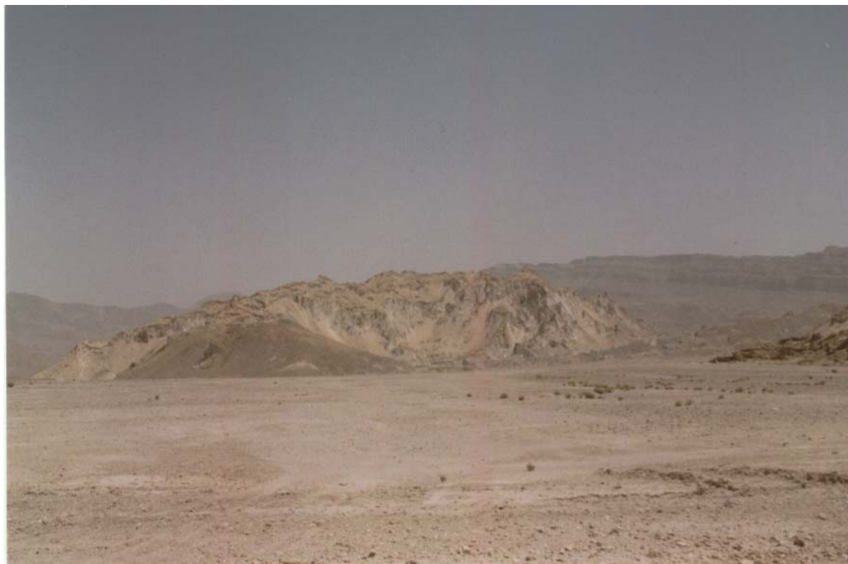
شکل ۱. سیمای طبیعی گنبد نمکی کرسیا در محدوده شهرستان داراب