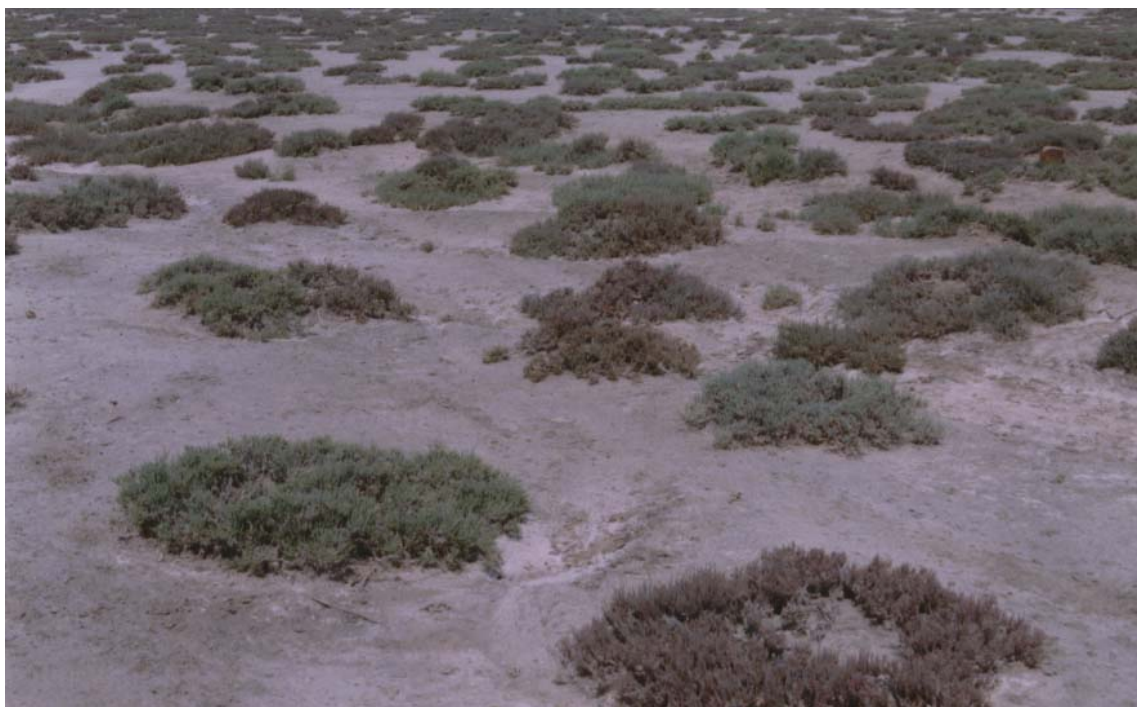
شکل ۳. سیمای تیپ گیاهی یک‌نواخت با غالبیت Halocnemum strobilaceum در منطقه دشت کرسیا

بیان کرد شورروی‌های گوشتی و آبدار مانند Halocnemum با مرگ آگاهانه قسمت‌هایی از بافت‌های گوشتی خود مقدار زیادی نمک را برای ادامه بقای از دست می‌دهند (۲۴). ایزمیل دریافت که میزان نمک محلول در اندام‌های مرده گیاه ۲۱/۵ درصد بود در حالی که میزان این املاح در قسمت‌های سرپا فقط ۵/۹ درصد بوده است (۲۶). باتانونی ضمن قرار دادن این گونه در گیاهان متحمل شوری، اشکال تطابقی آن با شرایط شوری را با تولید بافت‌های گوشتی، کاهش هدررفت آب از طریق چوب پنبه‌ای شدن اندام‌های مسن، تنظیم فشار اسمزی و افزایش تحمل بافت‌ها، سلول‌ها و اندام‌های خود نسبت به شوری بیان نمود. وی هم‌چنین ایجاد بافت چوب‌پنبه‌ای را در سطح اندام‌های مسن باعث ایجاد یک کشش برای ذخیره نمک در بافت‌های مرده بیان کرد (۲۰). باتانونی و ایوب برداشت علوفه توسط دام را از گیاهان شورروی گوشتی باعث کاهش شوری خاک دانسته و هم‌زمان با مصرف این گونه، مصرف علوفه‌های با شوری کم را توصیه نمودند (۱۸ و ۱۹). بنابراین