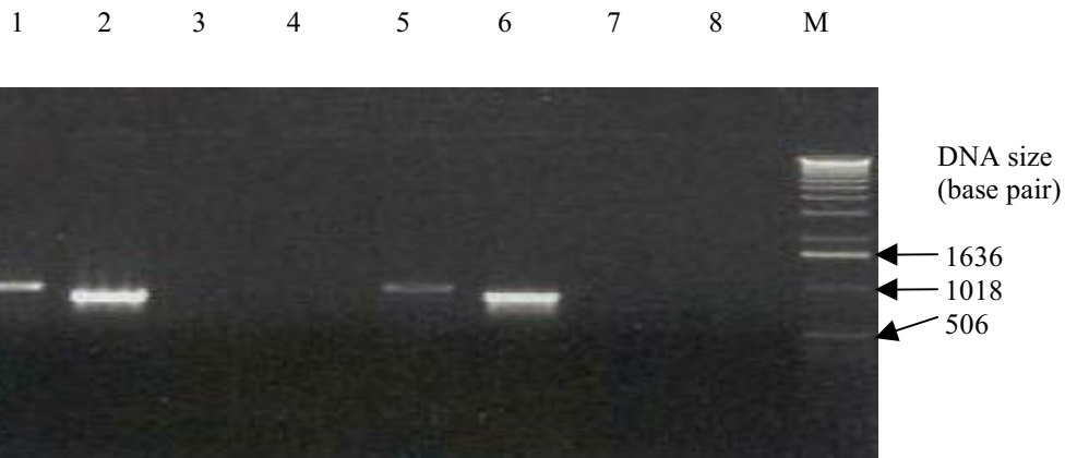
شکل ۳. نتایج PCR دو نمونه پلاسمید نوترکیب pAM-FLVAP با به اختصار pAMVAP با آغازگرهای مختلف برای تأیید همسو بودن