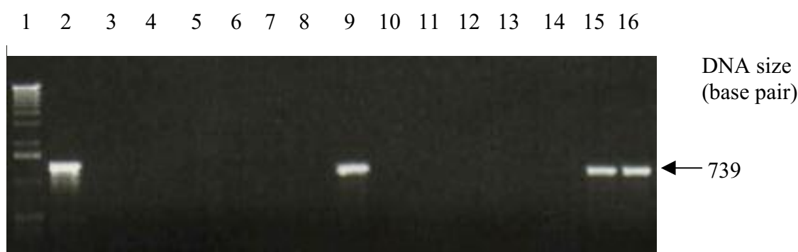
شکل ۵. نتایج آزمون PCR برای ریشه‌های مویین تراریخته BinOF2 برای تشخیص ژن GUS