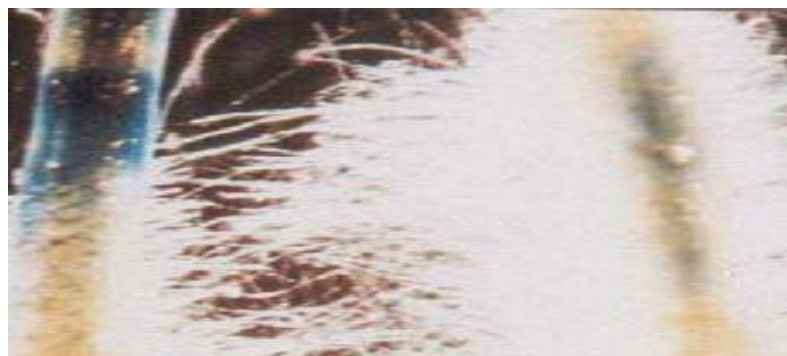
شکل ۴. ریشه‌های مویین تراریخته حامل ژن GUS با پروموتور CaMV35S پس از رنگ‌آمیزی. لکه‌های آبی در ریشه‌های مویین بیان ژن GUS را نشان می‌دهند.