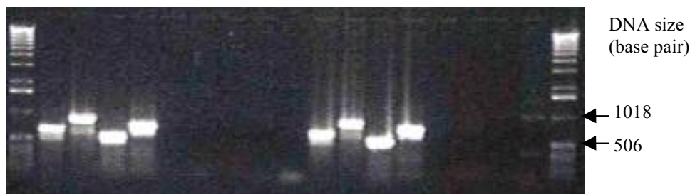
شکل ۱. نتایج PCR دو نمونه پلاسمید نو ترکیب pAM-FLOxF2R.2 با به اختصار pAMOF2 با آغازگرهای مختلف برای تأیید همسو بودن جهت ژن OF2 در مجاورت پروموتور CaMV35S

M 1 2 3 4 5 6 7 8 9 10 11 12 13 14 15 16 17 M