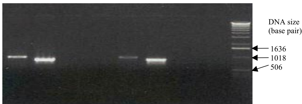
شکل ۳. نتایج PCR دو نمونه پلاسمید نوترکیب pAM-FLVAP با به اختصار pAMVAP با آغازگرهای مختلف برای تأیید همسو بودن جهت ژن VAP در مجاورت پروموتور CaMV35S