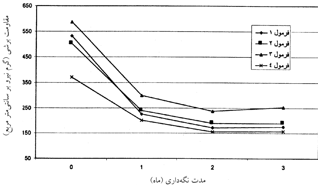
شکل ۱. تأثیر نوع فرمولاسیون و مدت نگهداری بر میزان مقاومت برشی بافت سوسیس‌های کنسرو شده برای دو نوع ظرف (میانگین دو نوع ظرف)