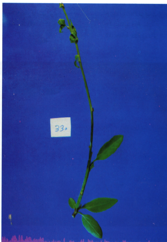
شکل ۲. ایجاد علائم شانکر در شاخه بادام در اثر مایه‌زنی با سوسپانسیون جدایه ۲۴ (بادام) Pseudomonas syringae pv. syringae