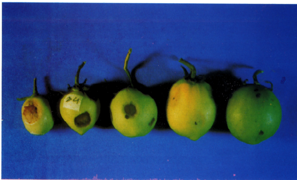
شکل ۱. مایه‌زنی میوه‌های نارس گوجه فرنگی با جدایه‌های شماره ۲۴ (بادام) و ۳۱ (کندم) Pseudomonas syringae pv. syringae (گوجه فرنگی سمت راست مایه‌زنی شده با جدایه غیر پاتوژن، شاهد منفی)