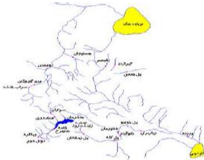
شکل ۲. ایستگاه‌های مورد بررسی در حوزه‌های آبخیز زاینده‌رود و قم

حوزه آبخیز سد زاینده‌رود، از شمال غرب به حوزه رودخانه دز، از جنوب به حوزه آبخیز رودخانه خرسان و از جنوب و غرب به بخش‌هایی از حوزه آبخیز کارون بزرگ محدود می‌گردد (شکل ۳).