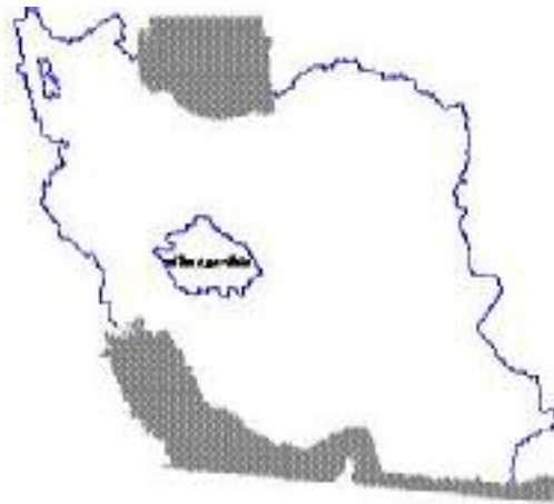
شکل ۱. منطقه مورد بررسی در ایران مرکزی