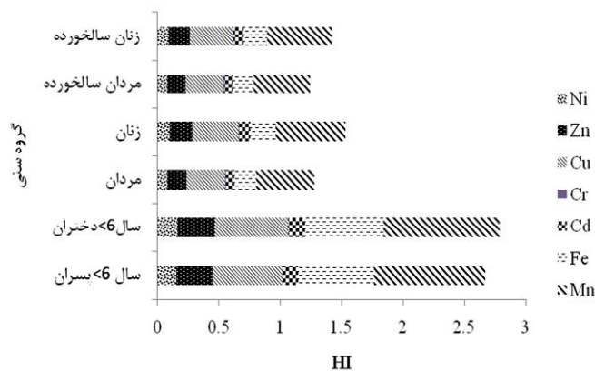
شکل ۳. شاخص خطرپذیری کل ناشی از مصرف محصولات کشاورزی (گندم، ذرت و سیب‌زمینی) در استان همدان

همچنین هو و همکاران (۱۵) گزارش کردند که میزان ورود Cd, Pb, Cu و Zn از طریق مصرف سبزیجات در نانجینگ چین کمتر از UL و مقدار THQ کمتر از یک برای کودکان و بزرگسالان می باشد که آنها بیان داشتند که عناصر سنگین از طریق مصرف سبزیجات سلامت مصرف کننده را تهدید نمی کند ولی بایستی به خطر تجمع در طولانی مدت عناصر سنگین مخصوصا در کودکان توجه شود. همچنین در ارتباط با ارزیابی خطر عناصر سنگین بر سلامت انسان از طریق مصرف محصولات کشاورزی و خاک می توان به مطالعه عقیلی و همکاران (۴ و ۵) در استان اصفهان و قم، یگانه و همکاران (۳۴) و (۳۵) در استان همدان و خوشگفتارمنش و همکاران (۲۰) در استان اصفهان اشاره کرد.