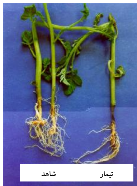
شکل ۱. علائم بیماری ساق سیاه باکتریایی سیب زمینی ایجاد شده توسط P. c. subsp. atrosepticum