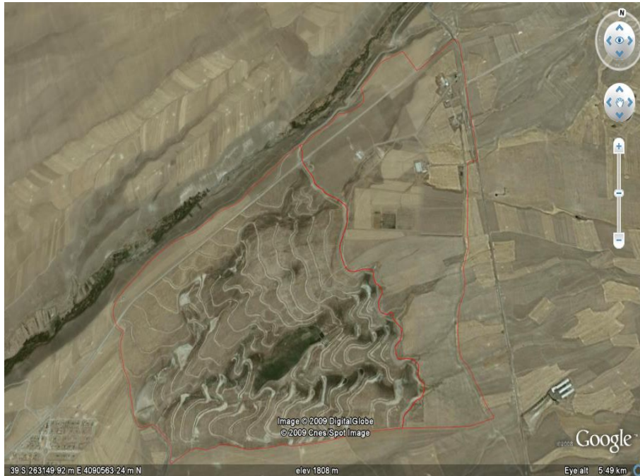
شکل ۱. تصویر ماهواره‌ای عرصه پخش سیلاب قره‌چریان در شمال غرب زنجان