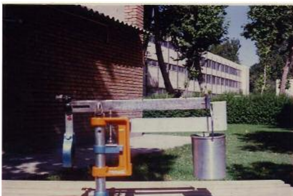
شکل ۱. دستگاه اندازه‌گیری مقاومت کششی