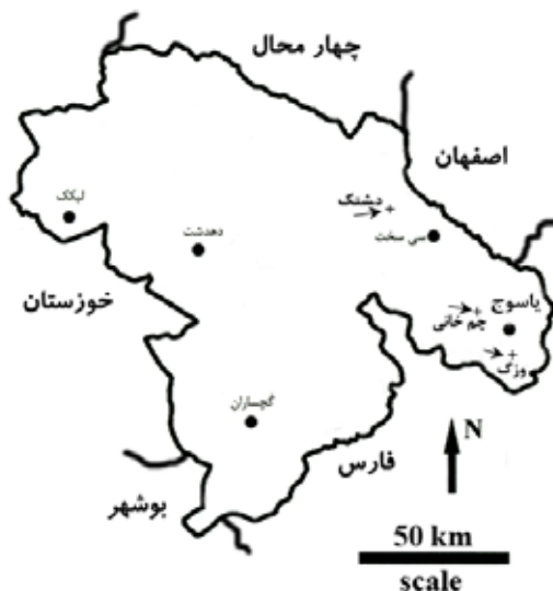
شکل ۱. موقعیت مناطق مطالعاتی در استان کهگیلویه و بویراحمد (نشان داده شده با پیکان)

تفاوت میان میزان کربنات کلسیم معادل در خاک سایه‌انداز و خارج آن در مناطق مطالعاتی الگوهای متفاوتی را نشان داده است. در حالی که این اختلاف در منطقه وزگ بی معنی بوده و در مناطق دشتک و چمخانی به ترتیب در سطوح ۱٪ و ۵٪ معنی‌دار بوده است. تغییرات میزان کربنات کلسیم معادل نسبت به عمق نیز در هر سه منطقه معنی‌دار بوده است. نتایج به دست آمده نشان می‌دهد که میانگین میزان کربنات کلسیم معادل در عمق ۲۰-۳۰ سانتی‌متر مناطق وزگ و چمخانی و اعماق ۴۰-۶۰ و ۲۰-۴۰ سانتی‌متر خاک منطقه دشتک معنی‌دار بوده است. در سایر مناطق و عمق‌ها میانگین اختلاف‌ها معنی‌دار نبوده است (جدول‌های ۲ و ۴). تفاوت میان میزان کربن آلی و نیتروژن کل در خاک سایه‌انداز و خارج آن و هم‌چنین بین