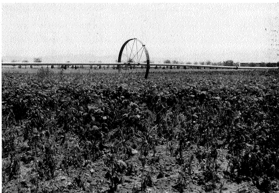
نگاره ۲. آلودگی شدید مزرعه لوبیا چیتی به بیماری سوختگی برگ و غلاف لوبیا