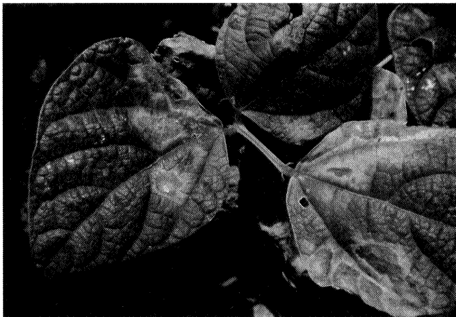
نگاره ۱. علائم بیماری سوختگی برگ و غلاف لوبیا روی برگ