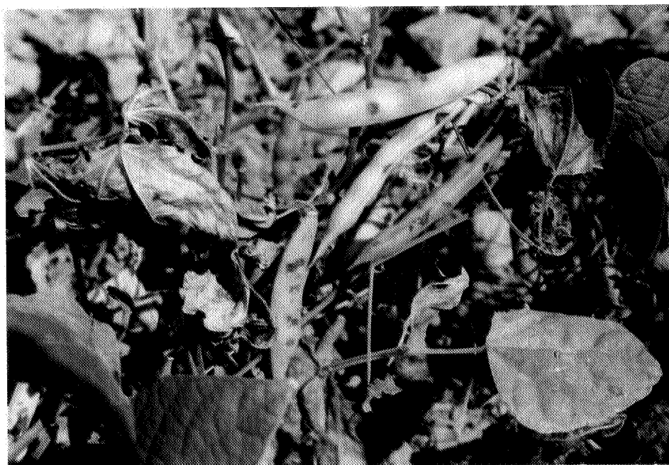
نگاره ۴. علائم بیماری سوختگی برگ و غلاف لوبیا روی غلاف