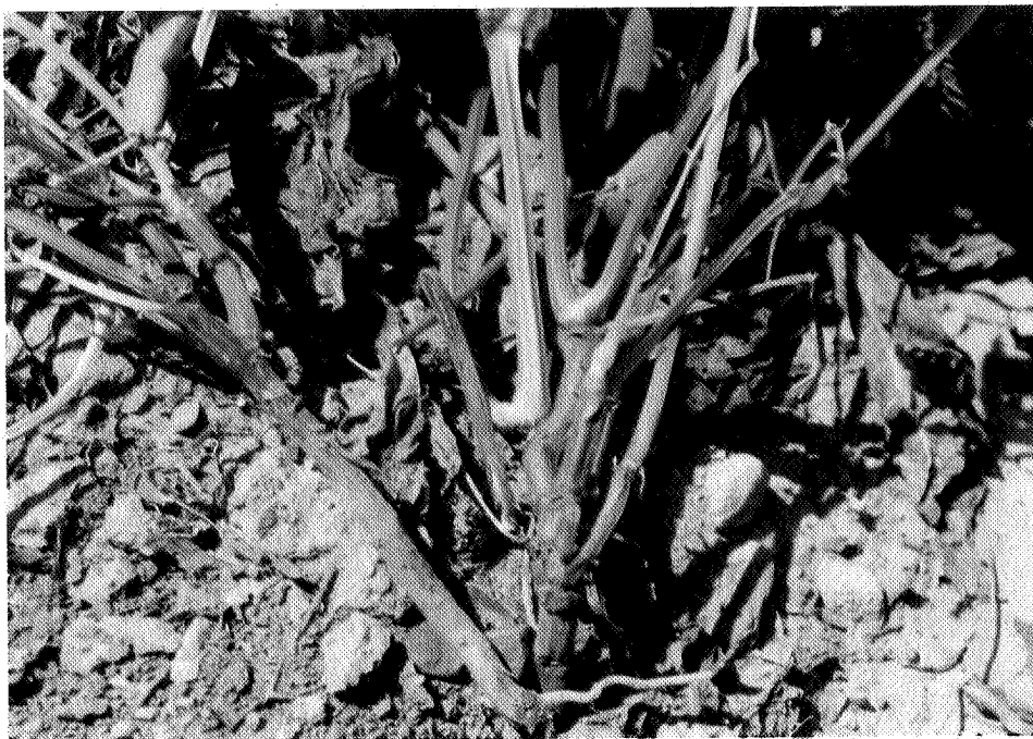
نگاره ۳. علائم بیماری سوختگی برگ و غلاف لوبیا در ساقه