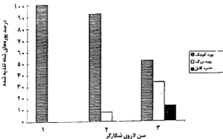
شکل ۲. ترکیب سنی شکار (شته سیاه باقلا) برای لاروهای شکارگر Leucopis glyphinivora Tanas.