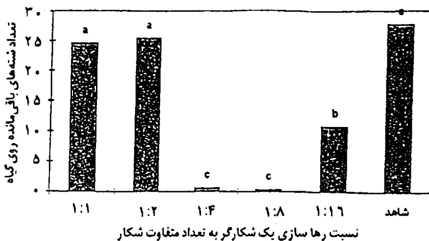
شکل ۳. شمار شته‌های باقی مانده روی گیاه باقلا پس از یازده روز (پایان دوره لاروی) و بعد از رها سازی شکارگر