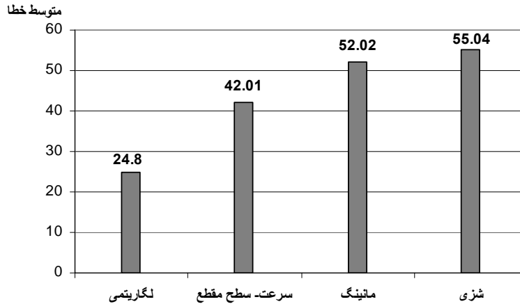
شکل ۳. مقایسه روش‌های مختلف امتداد منحنی دبی- اشل از نظر متوسط خطا در ۱۳ ایستگاه

باشد که ضریب زبری مانینگ نسبت به ضریب شزی با تغییر شعاع هیدرولیکی در اشل‌های بالا و سیلابی، کمتر دستخوش تغییر خواهد شد (۱۱). در این تحقیق ضریب زبری مانینگ و شزی در اشل‌های مختلف یکسان و ثابت فرض شده است که احتمالاً دقت پایین روش‌های مانینگ و شزی در ادامه دادن منحنی دبی- اشل را می‌توان حساسیت زیاد این ضرایب زبری و تغییرات آنها در اشل‌های مختلف دانست. در مواردی که رابطه دبی- اشل دارای ضریب تعیین پایین است و یا منحنی دبی- اشل از هم‌بستگی کمی برخوردار است، می‌توان علت آن را کمبود اندازه‌گیری در مقادیر مختلف دبی به ویژه در دبی‌های بالا و به میزان کمتری به کمبود اندازه‌گیری دبی‌های پایین دانست. همچنین پراکنش اندازه‌گیری دبی در روزهای مختلف سال باید به گونه‌ای باشد که دبی‌های مختلفی را بین حداقل و حداکثر شامل شود. به طور کلی باید گفت که در حال حاضر هیچ روش کاملاً مطلوبی که بتوان با اطمینان از آن در امتداد منحنی دبی- اشل استفاده کرد وجود ندارد و بسته به شرایط هر ایستگاه باید روش‌های مختلف را تست و مناسب‌ترین روش را انتخاب کرد.