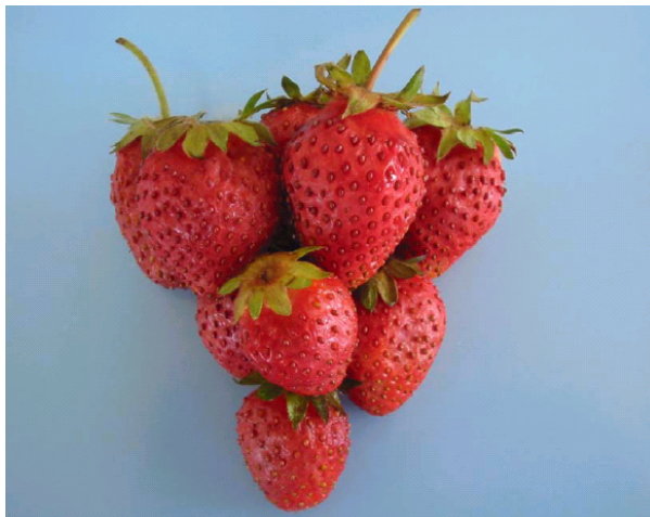
شکل ۲. نمونه‌های توت فرنگی ۲ ساعت پس از تیمار در محلول کلرید کلسیم

تازه‌خوری دارند توصیه نمود. ضمن آن که تلخی طعم حاصل از کاربرد املاح نیترات و تا حدی کلرید کلسیم نیز خود مزید بر علت است. به نظر می‌رسد روش محلول پاشی، قابلیت کاربرد در سطح تازه خوری این محصول را ندارد، اما استفاده از املاح سولفات و یا کلرید کلسیم (در غلظت‌های پایین) جهت آماده سازی نمونه قبل از اعمال فرایند انجماد برای نگه‌داری طولانی مدت و نیز برای توت فرنگی‌هایی که به مصرف تولید کنسانتره می‌رسند قابل بررسی است. چرا که به هر حال طی مرحله انجماد یا یخ‌زدایی توت فرنگی، حالت اولیه میوه تا حدی زایل می‌گردد و این امر حساسیت چندانی را ایجاد نمی‌کند ضمن آنکه کپک زدگی و لهیدگی محصول طی حمل و نقل کاهش می‌یابد. دسوزا، موریس و روزن (۱۰، ۱۵ و ۱۶) نیز توصیه مشابهی را برای محلول پاشی توت فرنگی با کلرید کلسیم به عمل آورده‌اند. به هر حال چنین به نظر می‌رسد که کماکان عملی‌ترین روش‌های کاهش ضایعات و افزایش عمر انبارداری محصول توت فرنگی برای مصارف تازه خوری، سرد کردن سریع محصول برداشت شده، جابه‌جایی و بسته‌بندی محصول در حجم‌های کوچک و ظروف کم عمق (حدود ۱۵ سانتی‌متر) و ذوزنقه‌ای شکل و استفاده از انبارهای سرد با دمای ۱- درجه سانتی‌گراد برای نگه‌داری کوتاه مدت محصول است.