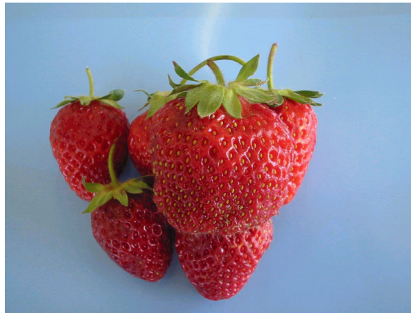
شکل ۱. نمونه‌های توت فرنگی قبل از اعمال تیمار

نتایج حاصل نشان می‌دهد که بین نمک‌های مختلف کلسیم نیز اختلاف معنی‌داری وجود دارد. نیترات کلسیم بالاترین و سولفات کلسیم کمترین اثر را در افزایش میزان کلسیم بافت دارا بودند. این نتیجه نیز با میزان حلالیت این نمک‌ها در محلول‌های مربوطه همخوانی دارد. اندازه‌گیری میزان کلسیم بافت در پایان روز پنجم و دهم نگهداری نمونه‌ها، نشان داد که میزان کلسیم نمونه‌ها با گذشت زمان به میزان اندکی افزایش میابد اما این افزایش معنی‌دار نبود. دسوزا، چانگ، چور و ویلموت و لیما (۷، ۸، ۱۰ و ۱۲) نیز اثرات مشابهی را در مورد رابطه بین میزان کلسیم بافت میوه‌ها و غلظت کلرید کلسیم مورد استفاده گزارش کردند.