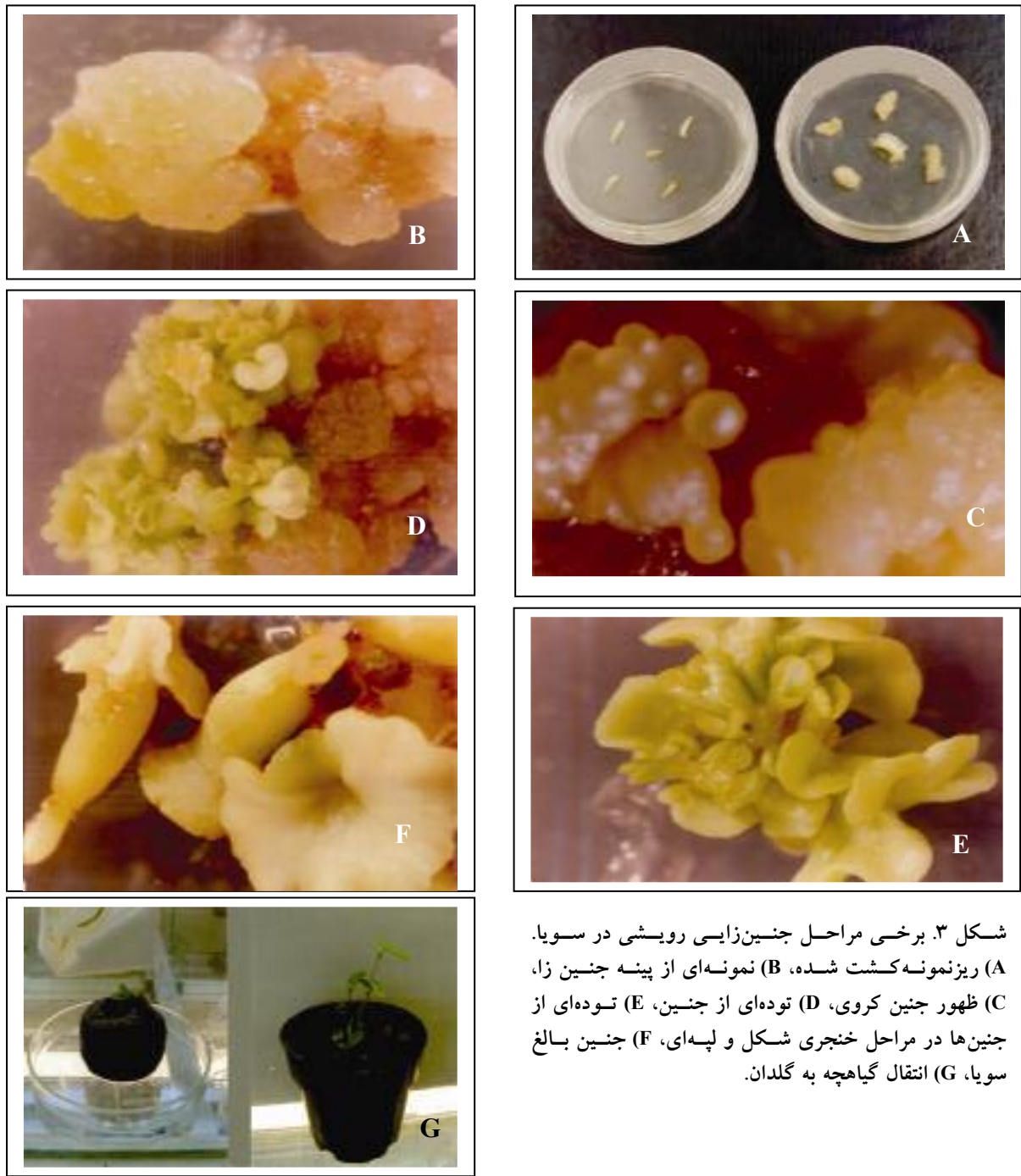
شکل ۳. برخی مراحل جنین‌زایی رویشی در سویا. (A) ریزنمونه کشت شده، (B) نمونه‌ای از پینه جنین‌زا، (C) ظهور جنین کروی، (D) توده‌ای از جنین، (E) توده‌ای از جنین‌ها در مراحل خنجری شکل و لپه‌ای، (F) جنین بالغ سویا، (G) انتقال گیاهچه به گلدان.