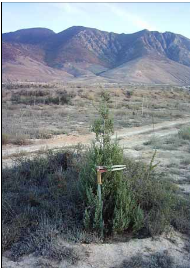
شکل ۲. نهال ارس Juniperus excelsa Bieb. در سطح ایستگاه تحقیقات آبخوان داری پشتکوه

نتایج تحقیق روی ارسستان‌های ایران نشان داده است اعمال قرق در رویشگاه‌های جزیره کبودان، چهارطاق اردل و لاین خراسان، افزایش زادآوری طبیعی این گونه را موجب شده است (۱۸). لازم به توضیح است زیستگاه گونه ارس در مناطق باز و مراتع کوهستانی قرار دارد. این گونه دامنه تحمل وسیعی از شرایط اکولوژیکی رویشگاه‌ها را داراست. بذر یا میوه‌های ارس توسط پرندگان کوهستان زی مانند کبک دری، کبک معمولی، تیهو و باقرقره به شدت مورد تغذیه قرار می‌گیرند و از مهم‌ترین عوامل حیاتی پراکنش این درختان نیز محسوب می‌شوند (۱۱). در ارتباط با ایستگاه تحقیقات آبخوان داری پشتکوه نیز به دلیل احداث کانال‌های آبرسان، نهرهای گسترشی و دروازه‌های عبور سیلاب جذب انواع گونه‌های پرندگان را در سطح عرصه آبخوان داری فراهم آورده است که از این جهت بر تکثیر طبیعی ارس تأثیری مثبت خواهد داشت. وجود