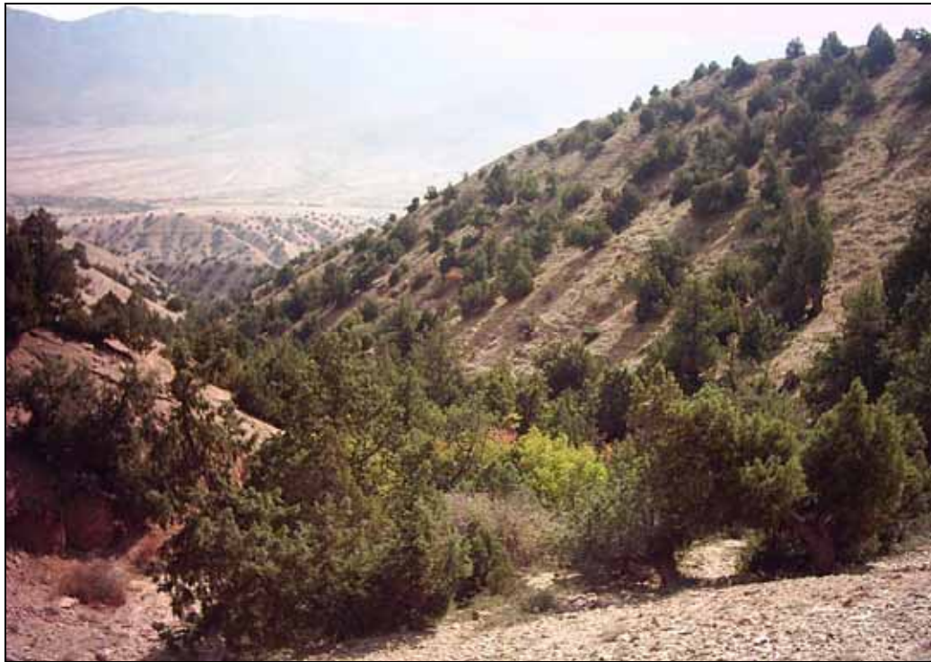
شکل ۳. درختان ارس Juniperus excelsa Bieb. در مناطق تخریب نیافته حوزه آبخیز پشتکوه

چرای مستقیم دام را نشان داده است (۲۴، ۲۸ و ۳۲). مطالعات انجام شده در کشور ما و به ویژه در گردنه چهارباغ نقش ارس‌های خزنده به خصوص Juniperus sabina را در امر حمایت از زاد آوری طبیعی نیز ثابت کرد به شکلی که در پناه یک بوته گسترده Juniperus sabina بیش از ۳۰ پایه درختی از گونه‌های مختلف شمارش شده است (۱۷). لازم به ذکر است گونه ارس Juniperus excelsa Bieb. در سطح حوزه پشتکوه و در طول سالیان دراز بخش‌هایی از دامنه‌های جنوبی و ارتفاعات پایینی دامنه‌های شمالی که دستخوش تخریب شدید اهالی منطقه بوده‌اند را به خود اختصاص داده است (شکل ۳). نهال‌های ارس نیز تنها گونه درختی می‌باشد که به صورت طبیعی در منطقه پشتکوه حضور دارد، از همین رو توجه بر تولید و تکثیر این گونه در عرصه آبخوانداری پشتکوه به همراه توسعه گونه‌های مرتعی در بین نهال‌های ارس (مرتع مشجر)، راهکاری متناسب با توسعه پایدار در سطح عرصه می‌باشد و این رویکرد با حداقل هزینه ضمن احیای جنگل‌های ارسستان حوزه پشتکوه، بیشترین تأثیر را بر روند توالی اکولوژیک