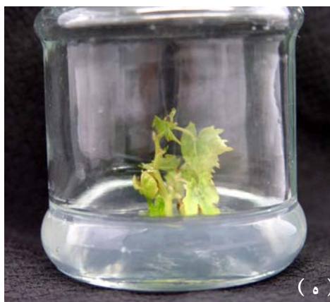
تصویر ۱. مطالعه اثر تنظیم‌کننده‌های رشد و نمک بر رشد شاخه: الف - ریزنمونه جوانه زده با قطر مناسب ساقه. ب - نمونه‌ای از شاخه‌رویی در محیط نمک MS با تنظیم‌کننده رشد BI. ج - رشد شاخساره در یکی از آزمایش‌ها در نمک WPM دو هفته پس از کشت. د - پرآوری در یکی از آزمایش‌ها در نمک WPM به مدت ۴۹ روز پس از کشت. ه - نمونه‌ای از شاخساره بدست آمده در محیط SEM برای طولیل شدن ساقه و رشد ریشه. و - پس از رشد کافی ریشه، شاخساره به خاک منتقل شده است.