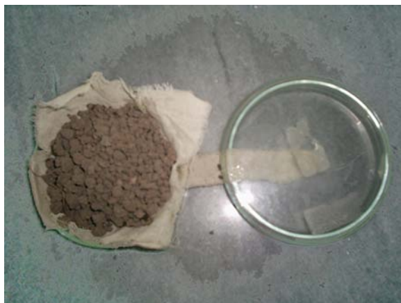
شکل ۱. پل آبی برای انتقال آب به ظرف دارای خاکدانه‌ها

اندازه‌گیری مقاومت کششی خاکدانه‌ها (۹) در رطوبت هوا-خشک و مکش ماتریک 500 \text{ kPa} استفاده شد. آزمایش‌های اولیه نشان داد که به دلیل پایداری اندک خاک‌های مورد بررسی، مقاومت کششی خاکدانه‌ها در مکش‌های ماتریک کمتر از 500 \text{ kPa} ناچیز بوده و تغییر شکل آنها عمدتاً خمیری و ماندگار می‌باشد که با اصول روش غیرمستقیم برزیلی مغایرت دارد. خاکدانه‌های با اندازه 3-8 \text{ mm} به روش الک خشک جدا شده و 30 عدد از آنها به‌طور تصادفی برای هر آزمایش انتخاب و وزن شدند. برای تیمار مکش ماتریک 500 \text{ kPa} ، 30 عدد از خاکدانه‌های مذکور انتخاب شده و مکش ماتریک آنها با استفاده از پل آبی (شکل ۱) به 500 \text{ kPa} رسانده شد. خاکدانه‌ها بین دو صفحه بارگذاری (با استفاده از دستگاه تک محوری (Uniaxial compression test)) شکسته شده و مقاومت کششی آنها به کمک رابطه زیر محاسبه شد: