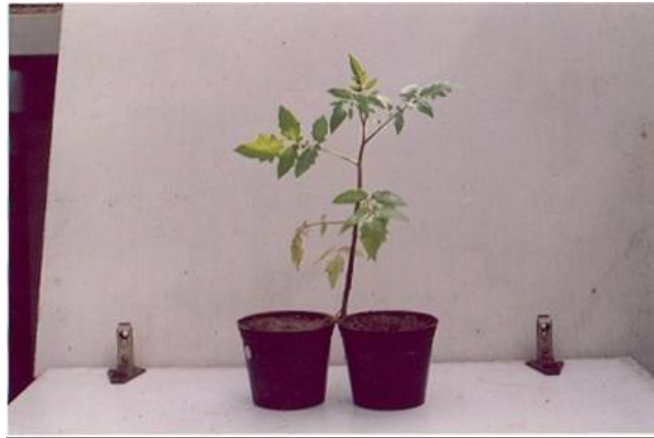
شکل ۱. تقسیم ریشه گیاه در دو گلدان مجاور برای مطالعه تأثیر سیستمیک نماتود مولد گره ریشه Meloidogyne javanica بر میزان بیماری و فعالیت آنزیم فنیل آلانین آمونیا لیا ز در تعامل با قارچ عامل بیماری پژمردگی فوزاریومی گوجه فرنگی Fusarium. oxysporum fsp lycopersici

واريته Roma VF و مدت زمان لازم برای رسیدن به ظهور بالغ‌های جوان به ترتیب دو روز و ۱۵ روز بر اساس صاحبانی در نظر گرفته شد (۱).