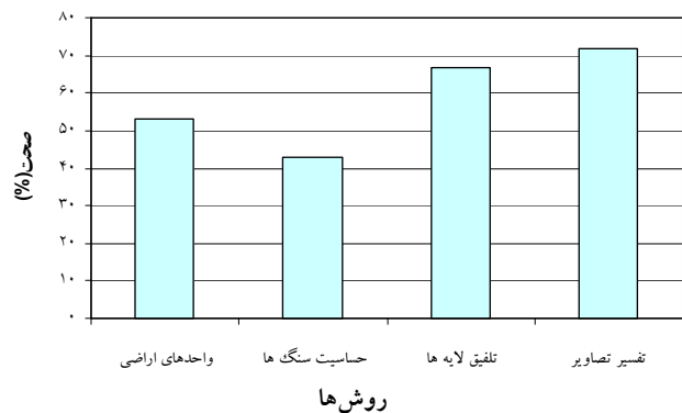
شکل ۱. صحت روش‌های مورد استفاده در تهیه نقشه شکل‌های مختلف فرسایش

شکل ۲ جذر میانگین مربعات خطای واحدهای کاری را نشان می‌دهد. این شاخص نیز نشان می‌دهد که روش تفسیر تصاویر ماهواره‌ای از خطای کمتری در تهیه نقشه شکل‌های فرسایش برخوردار است. اختلاف خطا با روش واحدهای اراضی و حساسیت سنگ‌ها بسیار زیاد است اما با روش تلفیق لایه‌ای اختلاف بسیار کمتری دارد.