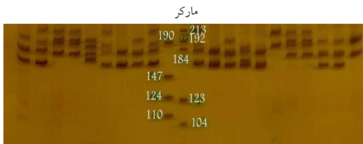
شکل ۱. الگوی باندها برای جایگاه MCMA2