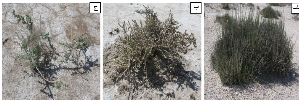
شکل ۲. سه گونه گیاهی مورد مطالعه شامل: الف) Juncus gerardi ، ب) Halocnemum strobilaceum و ج) Salsola rigida

دستگاه شعله‌سنج مدل Corning 405 اندازه‌گیری گردید. همه اندازه‌گیری‌ها در سه تکرار صورت گرفت.