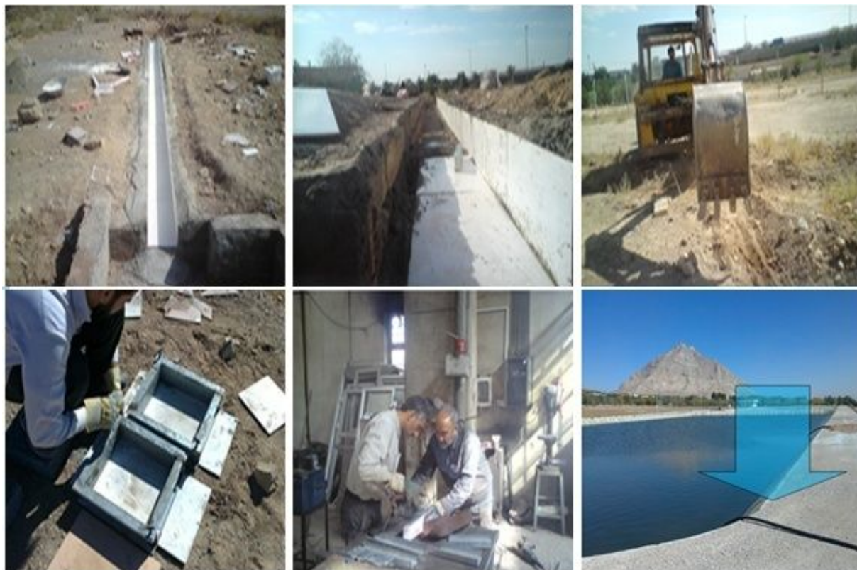
شکل ۳. مراحل گودبرداری، تهیه قالب بتن، عایق‌بندی کانال و تنظیم جریان ورودی به کانال

آن‌که حفرات بتن کمی ریزتر شوند در سه مرحله، که در هر مرحله ۱۰ درصد وزن درشت‌دانه، ریزدانه به طرح اختلاط پایه اضافه شد (۱۵). در نهایت چهار طرح اختلاط برای بتن متخلخل در اختیار می‌باشد. در جدول ۱ مشخصات طرح اختلاطها آورده شده است. در اینجا منظور از ریزدانه، شن عبور کرده از الک ۴ و مانده بر الک ۲۰۰ می‌باشد و درشت‌دانه ذرات شن ۴/۷۵ تا ۱۲/۵ میلی‌متر می‌باشد. در این تحقیق عیار سیمان ۳۳۰ کیلوگرم در مترمکعب به‌طور ثابت در نظر گرفته شده است. همچنین آب مورد استفاده آب شرب بوده است. نکته دیگر که با توجه به جدول ۱ باید مد نظر قرار گرفته شود این‌است که با افزوده شدن ریزدانه با توجه به مشاهدات آزمایشگاهی درصد w/c افزایش یافته تا خمیر بتن به‌صورت یکنواخت تهیه گردد و سیمان‌ها به‌صورت گلوله‌ای در نیاید. البته این افزایش درصد در محدوده مجاز توصیه شده توسط ACI211.3R می‌باشد. برای ساخت نمونه‌ها، مقادیر مصالح مصرفی در بتن مطابق طرح‌های اختلاط به‌وسیله ظروف حجمی مدرج اندازه‌گیری شد