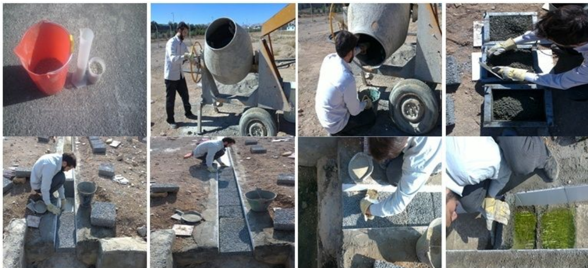
شکل ۴. مراحل تهیه بتن، قالب‌ریزی و قرارگیری بتن‌ها در کانال

آسیبی به جداره کانال وارد نیاید. در هر بار آزمایش تعداد ۱۱ مکعب در کانال قرار داده شد. نکته دیگر آنکه در هنگام ساخت قالب بتن‌ریزی، عرض قالب ۵/۰ سانتی‌متر کمتر از کانال گرفته‌شد؛ دلیل این امر سهولت در جای گذاشتن و برداشت مکعب‌ها در کانال می‌باشد. فضای ایجاد شده با شن عبوری از الک ۱۴ به‌همراه مقداری سیمان (جهت پایدارشدن شن‌ها) پر شد. این مراحل انجام کار در شکل ۴ نشان داده شده است.