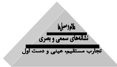
شکل ۱. مثلث ادگار دیل

اصولاً هر تولید هنری بر اساس یک اصل مهم یعنی ارتباط شکل می‌گیرد و در بین همه هنرها، کاریکاتور در این زمینه پیشتاز است (۳۵ و ۲). هنر کاریکاتور چندان جدید نیست و در این که واژه کاریکاتور در عصر باستان وجود داشته و مورد استفاده بوده است شکی نیست و نقاب‌های برجای مانده از قبیله‌های منقرض شده و اشکال ترسیم شده در دیواره غارها همگی از نخستین کاریکاتورهای ماندگار جهان هستند. ریشه واژه کاریکاتور، از واژه یونان باستان "کاریکا" یا "کاریکاتور" به معنای غلو و پر کردن گرفته شده است (۳) (عده‌ای نیز اعتقاد دارند واژه کاریکاتور از نام آینه‌اله کاراچی، مخترع کاریکاتور موضوع‌دار گرفته شده است و به عقیده این گروه از تاریخ دانان واژه کاریکاتور برای نخستین بار در سال ۱۹۴۶ میلادی پدید آمد). امروزه، کاریکاتور به عنوان "هنر بزرگ" (Grand Art) مطرح و در میان سایر رشته‌های هنری از جایگاه ویژه‌ای برخوردار است (۳۶). زیرا، هنرهای تجسمی به تاریخ پیوسته‌اند ولی کاریکاتور، یک پدیده مربوط به زمان، یعنی قرن بیست و یکم و هنری یگانه است (۸، ۱۱، ۱۴ و ۱۶).