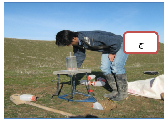
شکل ۱. مراحل مختلف نمونه برداری: شناسایی محل نصب پلات (الف)، مستقر نمودن پلات (ب)، نصب باران ساز بر روی پلات (ج) و انجام نمونه برداری و برداشت روان آب و رسوب (د).

تجزیه و آریانس مرکب برای خصوصیات خاک اعمال و روند تغییرات فصلی با تفکیک موقعیت شیب مورد بررسی قرار گرفت. نتایج در جدول ۲ و شکل ۳ ارائه شده است.