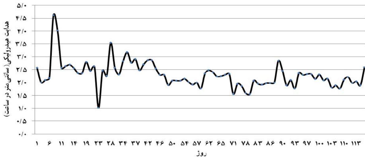
شکل ۱. تغییرات K در مدت انجام آزمایش