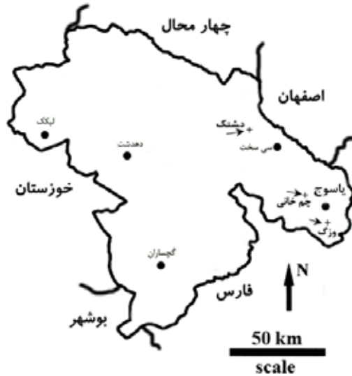
شکل ۱. موقعیت مناطق مطالعاتی در استان کهگیلویه و بویراحمد (نشان داده شده با پیکان)

تفاوت میان میزان کربنات کلسیم معادل در خاک سایه‌انداز و خارج آن در مناطق مطالعاتی الگوهای متفاوتی را نشان داده است. در حالی که این اختلاف در منطقه وزگ بی معنی بوده و در مناطق دشتک و چمخانی به ترتیب در سطوح ۱٪ و ۵٪ معنی‌دار بوده است. تغییرات میزان کربنات کلسیم معادل نسبت به عمق نیز در هر سه منطقه معنی‌دار بوده است. نتایج به دست آمده نشان می‌دهد که میانگین میزان کربنات کلسیم معادل در عمق ۲۰-۳۰ سانتی‌متر مناطق وزگ و چمخانی و اعماق ۴۰-۶۰ و ۲۰-۴۰ سانتی‌متر خاک منطقه دشتک معنی‌دار بوده است. در سایر مناطق و عمق‌ها میانگین اختلاف‌ها معنی‌دار نبوده است (جدول‌های ۲ و ۴). تفاوت میان میزان کربن آلی و نیتروژن کل در خاک سایه‌انداز و خارج آن و هم‌چنین بین