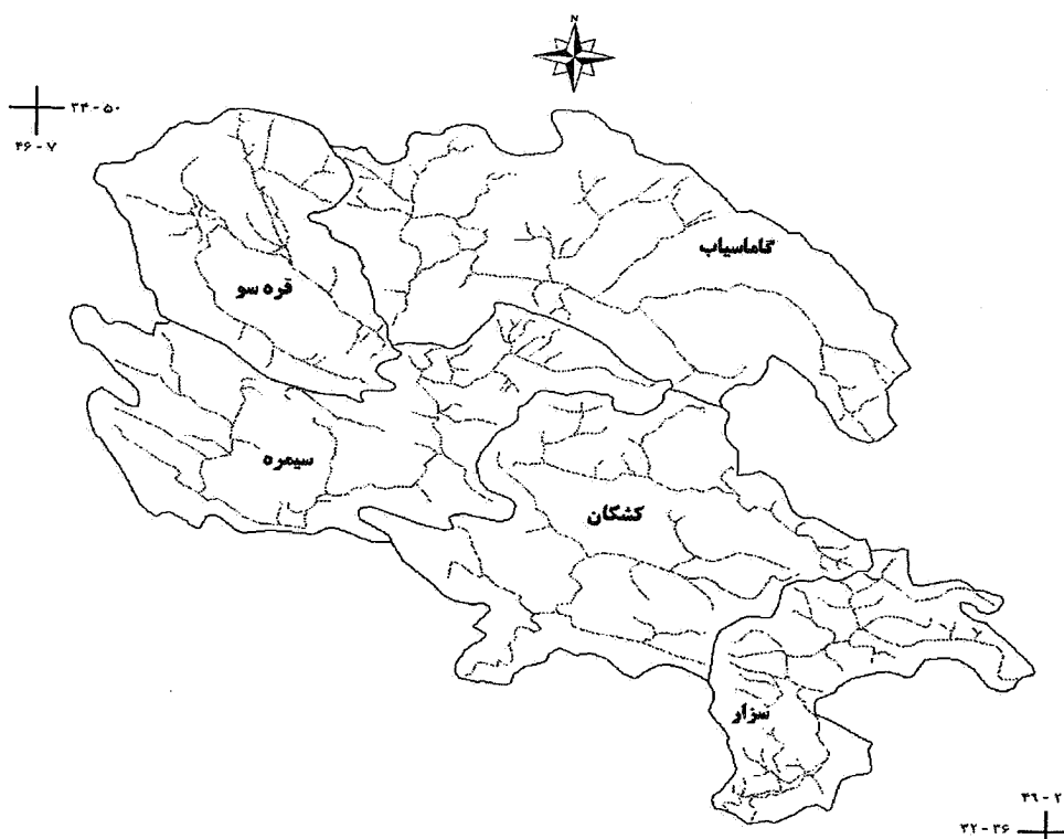
شکل ۱. حوزه‌های آبخیز مورد مطالعه