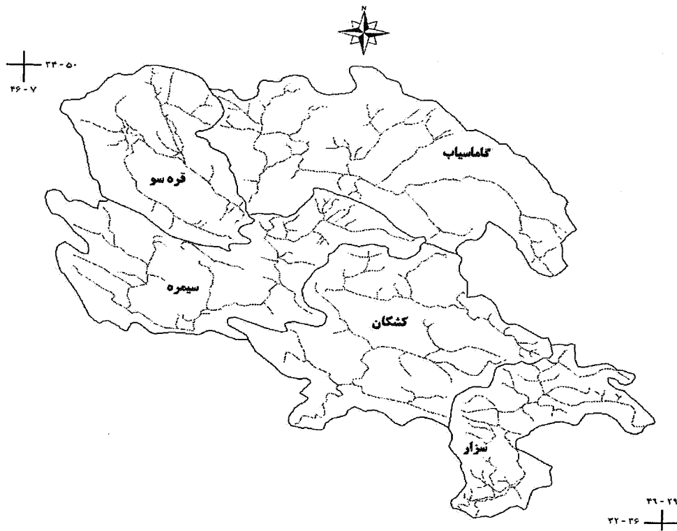
شکل ۱. حوزه‌های آبخیز مورد مطالعه