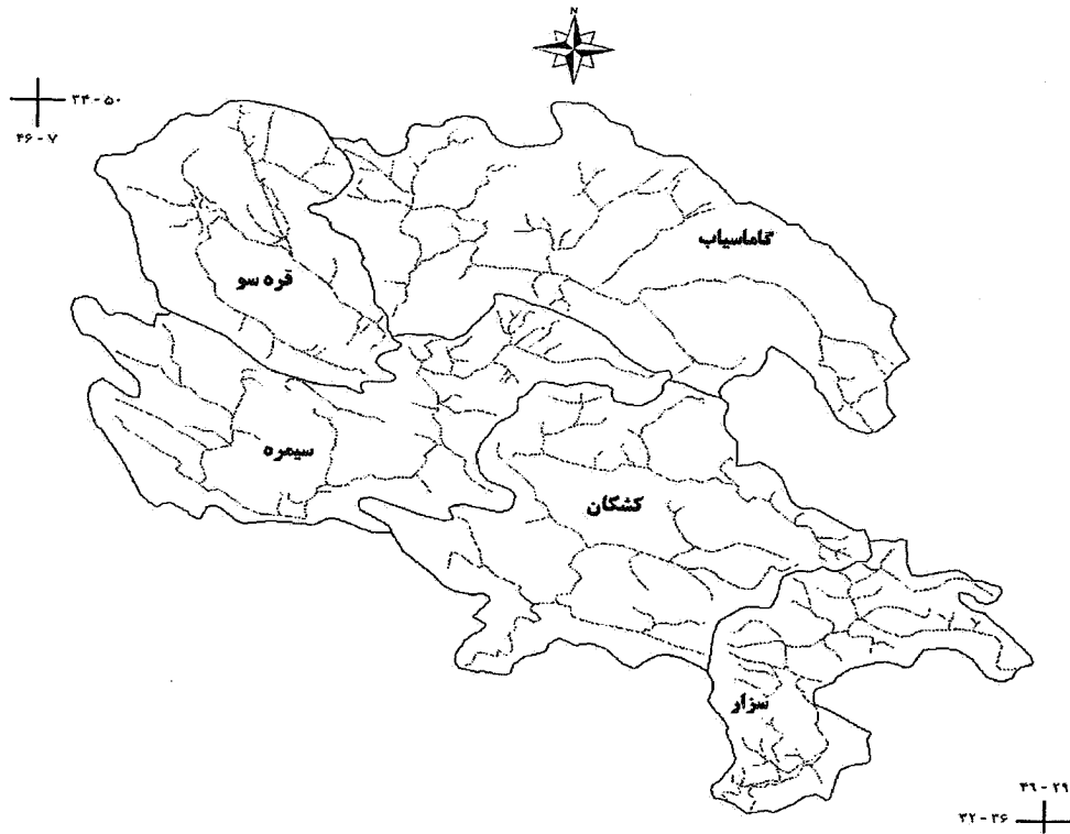
شکل ۱. حوزه‌های آبخیز مورد مطالعه