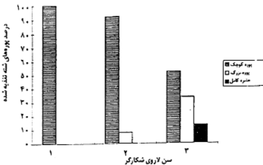
شکل ۲. ترکیب سنی شکار (شته سیاه باقلا) برای لاروهای شکارگر Leucopis glyphinivora Tanas.