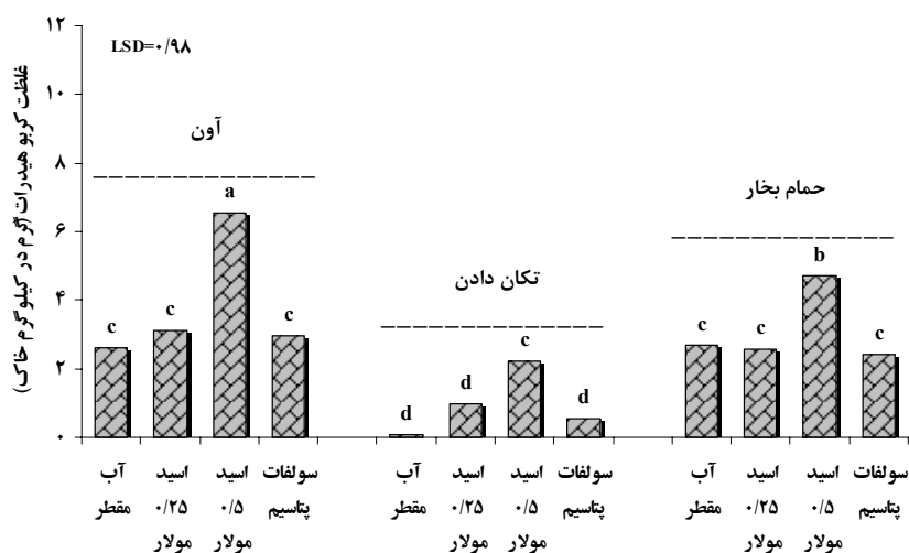
شکل ۲. مقادیر کربوهیدرات اندازه‌گیری شده با روش و عصاره‌گیرهای مختلف در خاک رسی میانگین‌ها با حروف مشابه، فاقد اختلاف معنی‌دار در سطح ۵ درصد آزمون LSD می‌باشند.