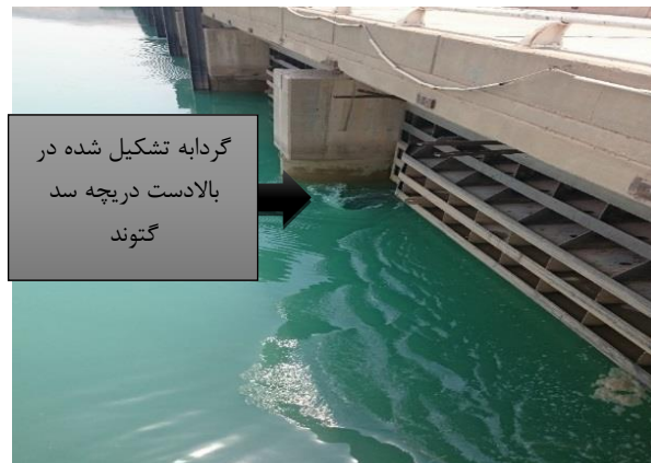
شکل ۱. گردابه تشکیل شده در پشت دریچه سد

جریان در اعماق مختلف نشان از تشکیل گردابه دارد که علت آن اختلاف در پتانسیل سرعت جریان است. سرکرده و همکاران (۱۵)، شبیه‌سازی عددی و تحلیل جریان را در مخزن همراه با گرداب‌های قوی انجام دادند. آنها مدل عددی خود را با داده‌های آزمایشگاهی و تئوری موجود صحت‌سنجی کردند. آزمایش‌های آنها در یک مخزن با گردابه‌های قوی در بالای آبگیر انجام شد. آنها یک الگوی جریان به شکل قیف در بالای آبگیر مخزن به رسمیت شناختند و مرزهای جریان را نیز تعریف کردند.