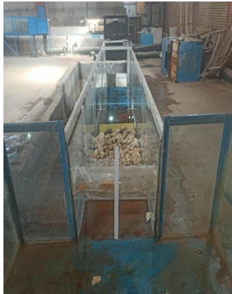
شکل ۲. فلوم آزمایشگاهی