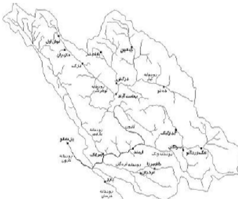
شکل ۳. ایستگاه‌های مورد بررسی در حوزه آبخیز کارون شمالی

منحنی، و توزیع‌های دارای چهار یا پنج پارامتر نظیر ویکبی به صورت ناحیه نشان داده شده است (۱۱). برابر با این نمودار، مناسب‌ترین توزیع برای ایستگاه‌های مورد بررسی به دست آمده است (جدول ۴).