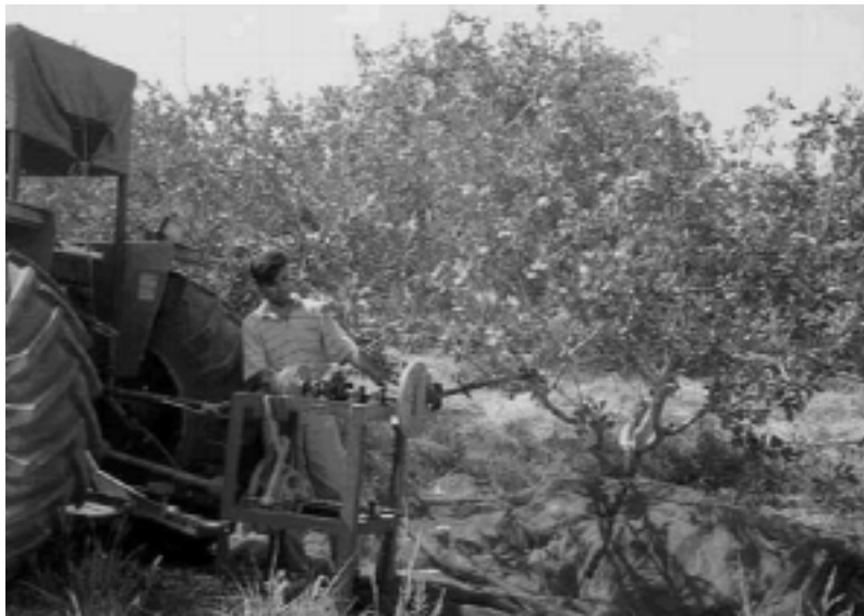
ب) تصویری از دستگاه شاخه تکان در حال ارتعاش شاخه

شکل ۱. تصاویری از مکانیزم انتقال حرکت و نحوه اتصال دستگاه شاخه تکان به هنگام اجرای یکی از آزمون‌ها