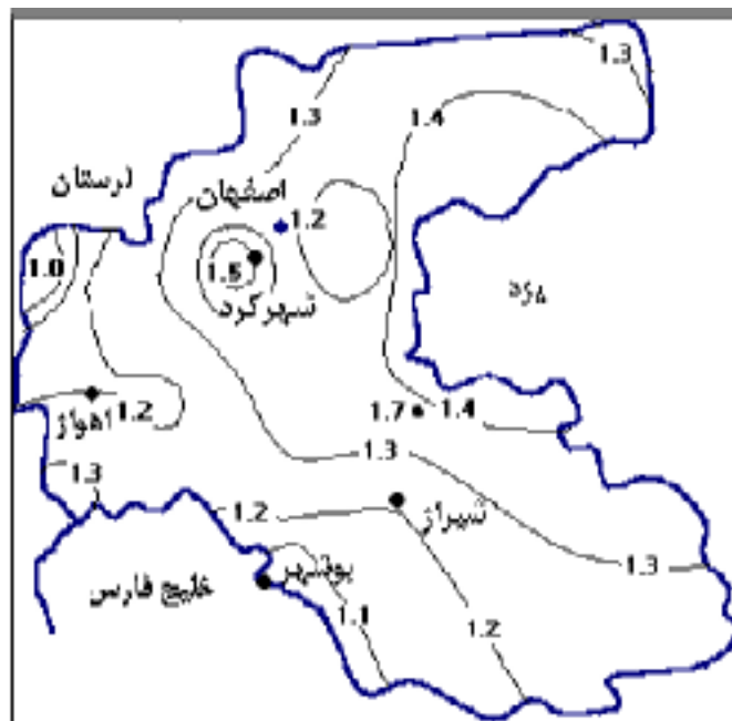
شکل ۳. توزیع جغرافیایی نسبت R_{EI}/R_b برای منطقه مورد بررسی

آبادیه در شمال شرقی شیراز)، که نشانه تأثیر شدیدتر این پدیده بر بارندگی این ایستگاه است. با این وجود، گرچه وقوع ال نینو در سال‌های ۱۳۵۶، ۱۳۷۰، ۱۳۷۱، ۱۳۷۳ و ۱۳۷۶ شمسی، برابر انتظار، افزایش شدید بارندگی در ایستگاه آبادیه را موجب شده،