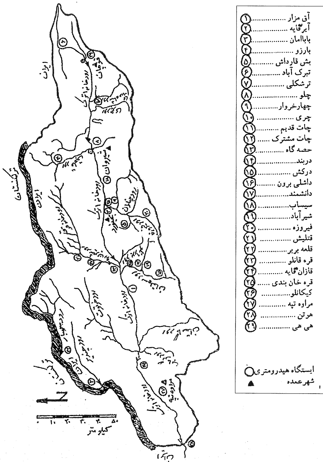
شکل ۲- موقعیت حوضه آبخیز اتوک