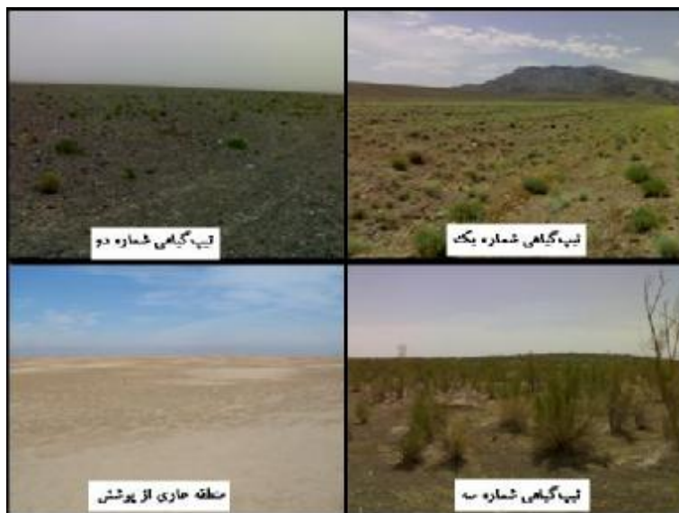
شکل ۱. سیمای عمومی چهار مکان مورد مطالعه در منطقه دق سرخ اردستان

تفاوت موجود بین خاک منطقه دارای پوشش و منطقه عاری از پوشش، آمار کمی ۲۲ عامل خاک مکان‌های چهارگانه بر اساس شاخص فاصله اقلیدوسی نسبی (به عنوان معیار فاصله‌ای)، به روش واریانس حداقل (واردز ۱۹۶۳) مورد تجزیه خوشه‌ای قرار گرفت. فاصله اقلیدوسی نسبی همانند فاصله اقلیدوسی است با این تفاوت که در آن داده‌ها به مقیاس طبیعی در آورده می‌شود. پردازش داده‌ها به وسیله نرم‌افزار PC-ORD تحت ویندوز (نسخه ۴/۱۷). پس از استانداردسازی انجام گرفت و نتایج طبقه‌بندی به صورت دندروگرام ترسیم شد. برای تشخیص نقش عامل‌های خاک در ساخت گروه‌های دندروگرام و اطمینان بیشتر از گروه‌بندی انجام شده، تجزیه واریانس یک طرفه با روش دانکن و بر مبنای طرح کاملاً تصادفی نامتعادل انجام گرفت (۱۲). تجزیه واریانس به وسیله نرم افزار SPSS نسخه ۱۵، تحت ویندوز انجام شد.